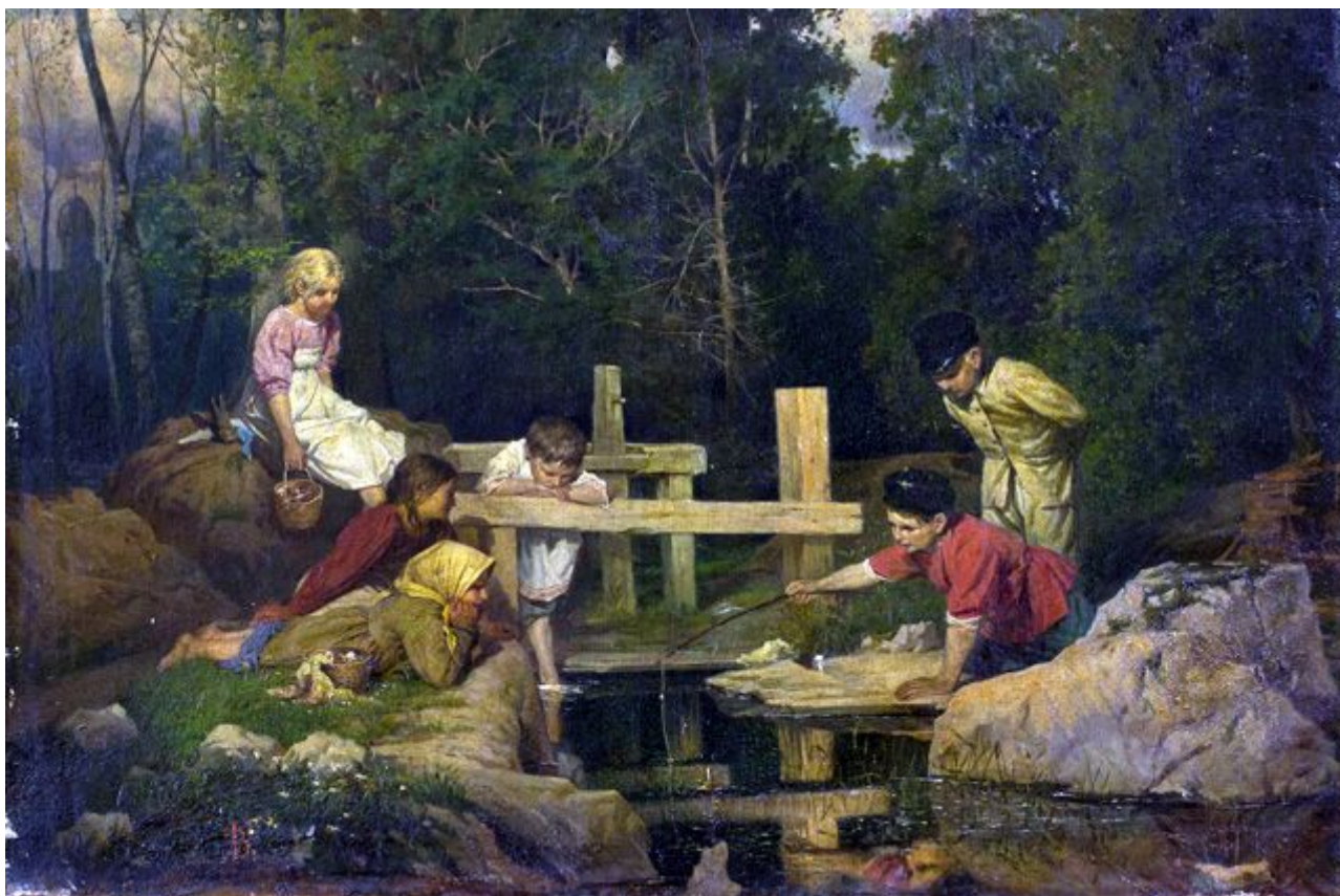
«Рыбная ловля» Василия Голынского.

Почему возвращение культурных ценностей на родину такая редкость? Что толкает коллекционеров живописи обращаться к «теневому рынку»? И есть ли на Западе повышенный интерес к русским художникам, в интервью АиФ.ru рассказал эксперт Александр Попов.