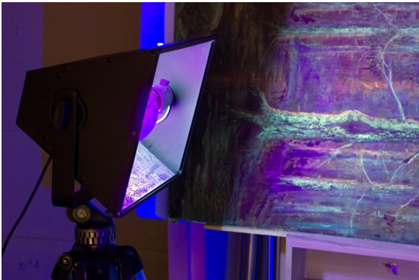
Экспертиза картины.

Вопрос с частным владением совершенно не отрегулирован. И он встречается не только в нашей стране и не только в связи со Второй мировой войной, каждая война сопровождается такими перемещениями и тотальным мародёрством.