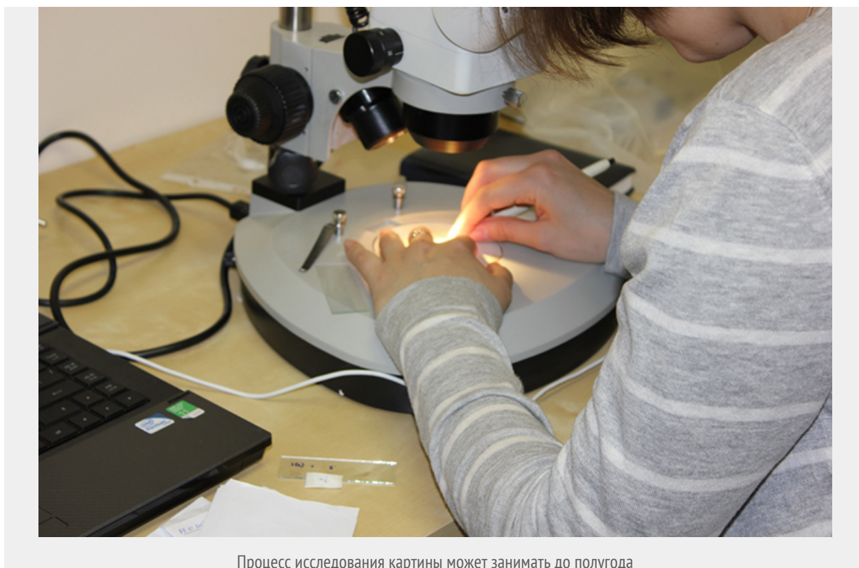
Процесс исследования картины может занимать до полугода

Мы помимо всяких технологических исследований проводим работу с архивами, литературой. Иногда удается восстановить провенанс. Хотя бы частично. Так, у нас была на исследовании картина художника Константина Крыжицкого. Это был подлинник. Но мы нашли замазанный штамп. При помощи специального оборудования прочли его. Оказалось, что это штамп личной коллекции императрицы Александры Федоровны. И потом мы нашли, что, действительно, эта вещь была репродуцирована в одном из выставочных каталогов начала XX века. Было указано, что это собственность императрицы.